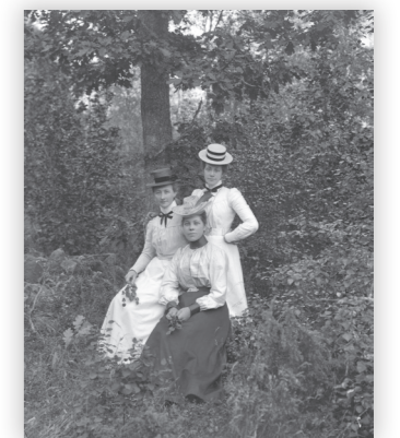
Pancy Svärm med syster och okänd kvinna.

▶ Anknyter till sjunde kapitlet "Bortom kyrkböckerna" i handboken.