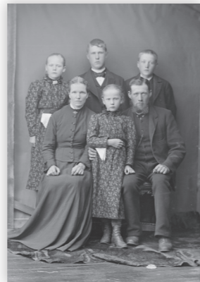
Familjen Skog.

Gå igenom flyttlängderna. Utgå från flyttnoteringar i husförhörslängder/församlingsböcker. Visa ett exempel på en person eller